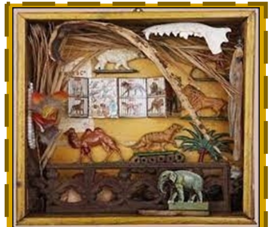
http://arts-plastique.acbesancon.fr/2019/10/31/cabinet-de-curiosité/Pina DELVAUX, Boîte à secrets