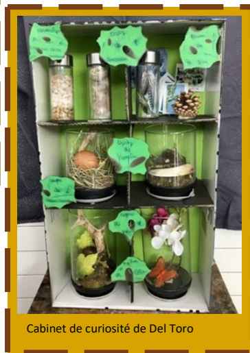
Cabinet de curiosité de Del Toro